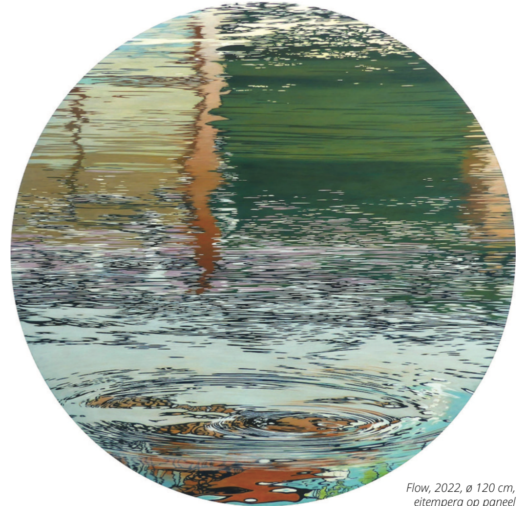
Flow, 2022, ø 120 cm, eitempera op paneel