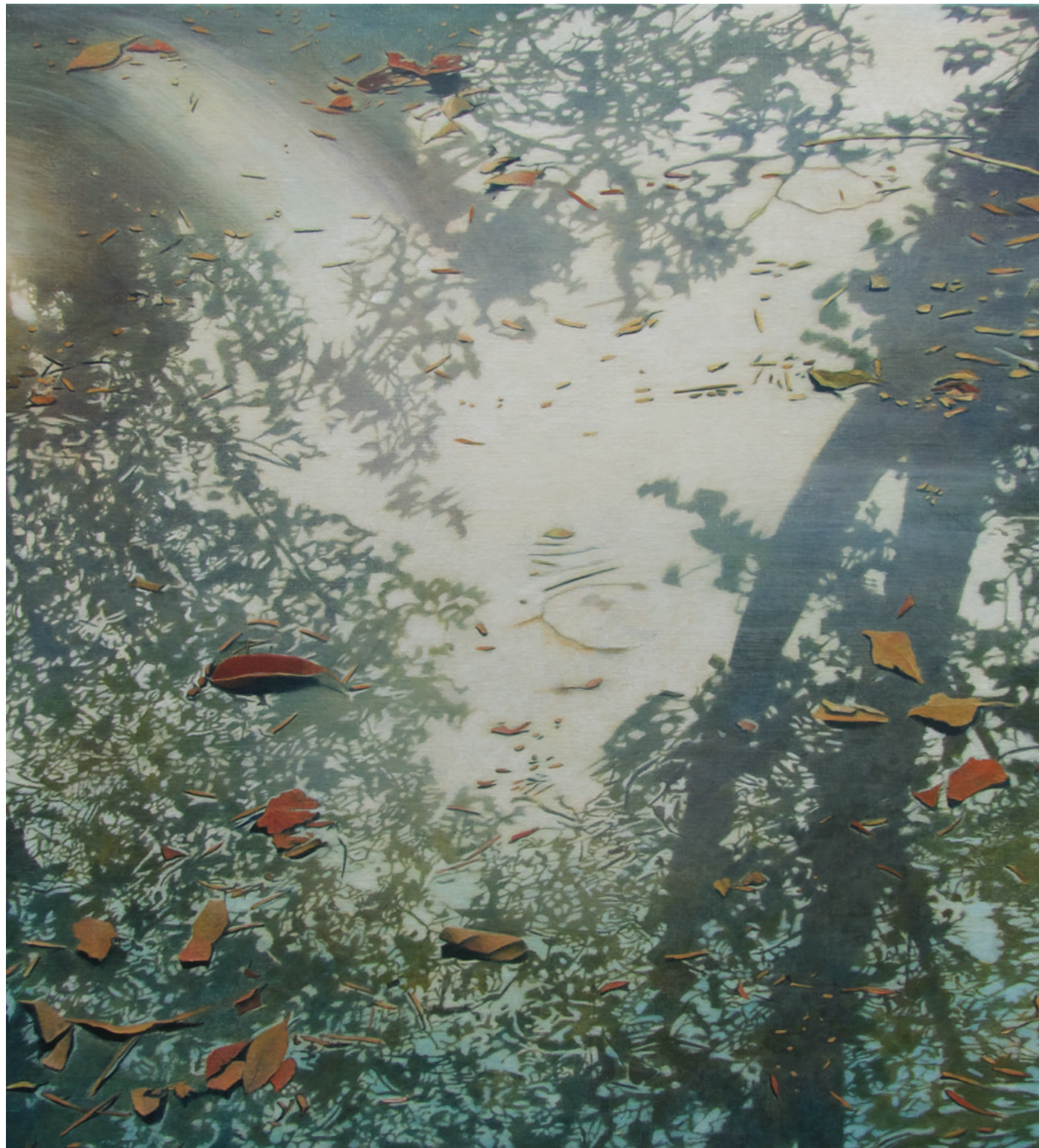
Forest Reflection VI, 2024, 80 x 80 cm, eitempera op linnen