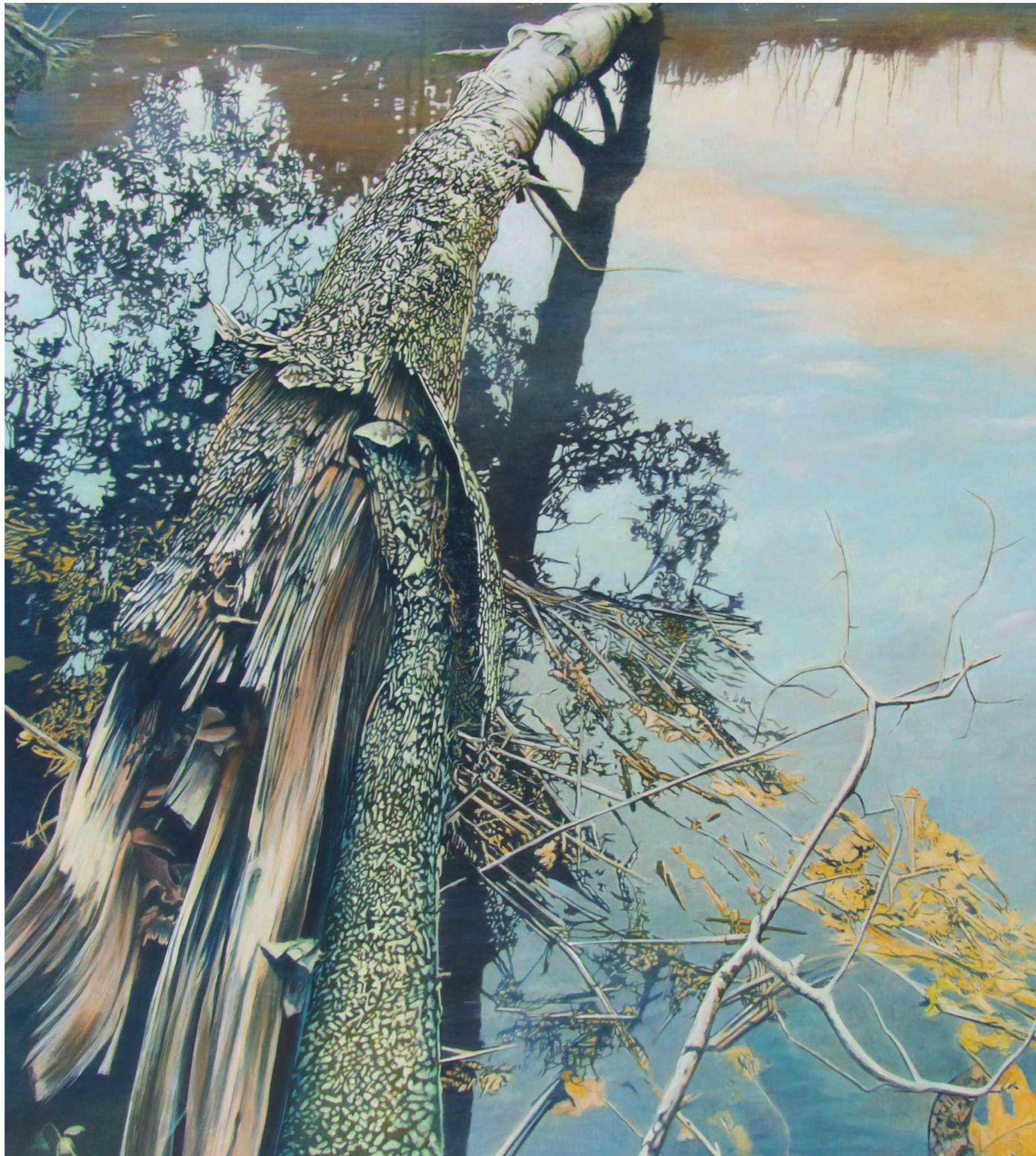
Bridge, 2024, 120 x 100 cm, eitempera op linnen, 2024, particuliere collectie